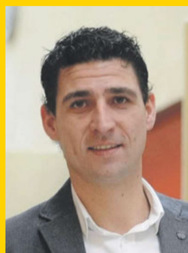
11 - Cor Huis